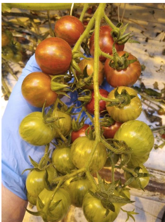
Рисунок 6 – Бейби Тайгер, 7 кисть

способность к образованию сложных кистей с большим количеством плодов до 16 -18 кисти включительно (рисунки 6-9).