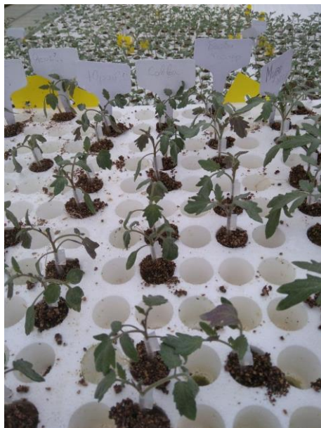
Рисунок 1. Привитые растения.