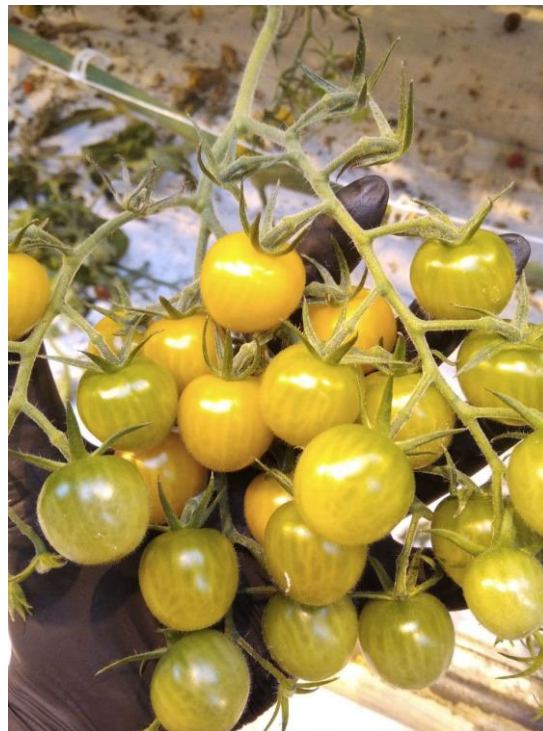
Рисунок 9 – Ясик, 14 кисть

Наилучшие вкусовые качества продемонстрировали исследуемые гибриды Ясик и Черри от Юрия.