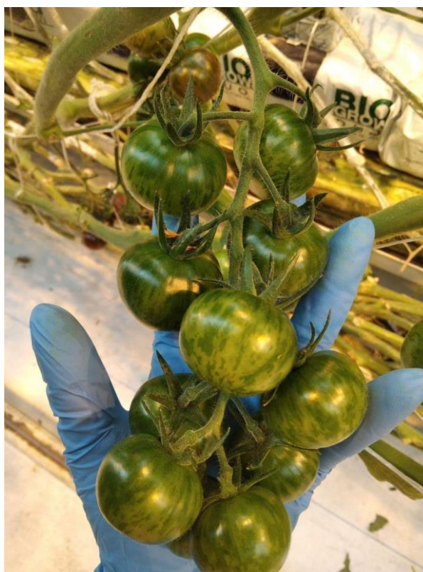
Рисунок 7 – Бейби Тайгер, 13 кисть