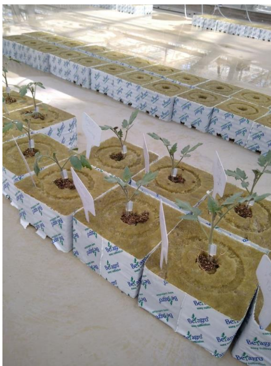
Рисунок 2. Пикировка растений в минераловатные кубики.

Поскольку выращивание рассады проводилось в летнее время, дополнительное досвечивание не использовалось. Температура в культивационном отделении в дневное время поднималась до 30-35 градусов, однако все выбранные гибриды продемонстрировали хорошую устойчивость к сложным климатическим условиям.