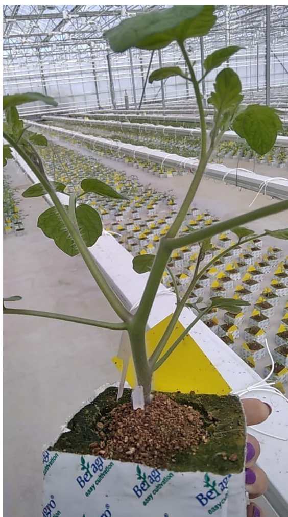
Рисунок 3. Формирование трех боковых побегов.

09.08.2020 г проведена прищипка верхушки растений над 3 настоящим листом с целью сформировать 3 полноценных боковых побега (рисунок 3). В течение последующих 2 недель произошло отрастание боковых побегов и формирование полноценной корневой системы в минераловатом кубике.