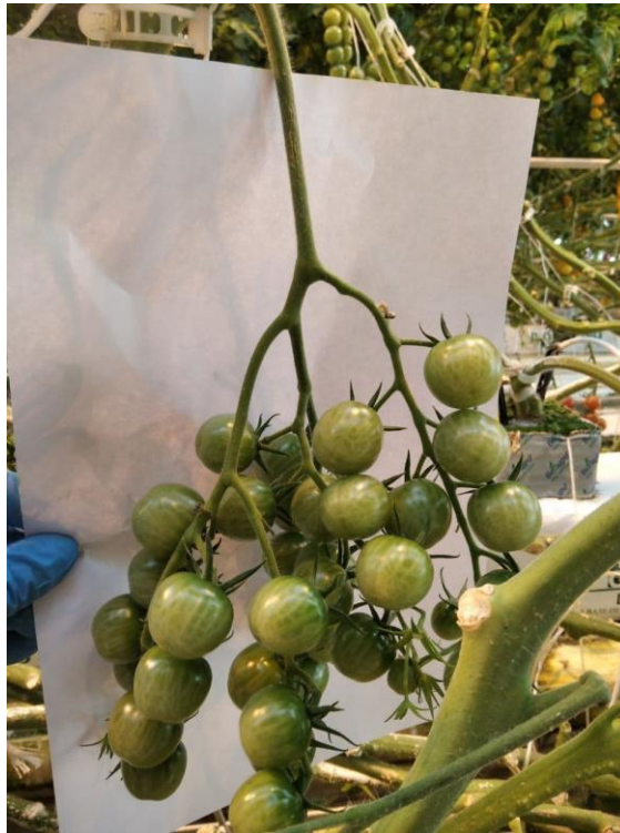
Рисунок 8 – Ясик, 10 кисть